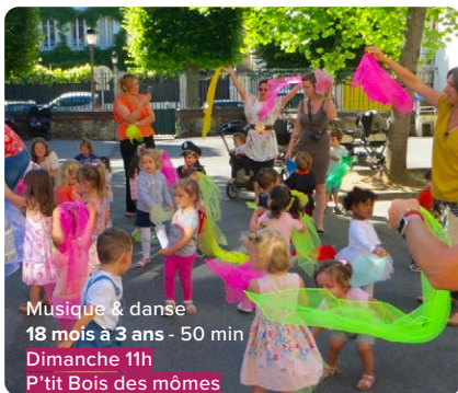
Musique & danse 18 mois à 3 ans - 50 min Dimanche 11h P'tit Bois des mômes

En ronde ou en farandole, ils nous feront danser, sauter, tourner, nous amuser et passer un bon moment, petits et grands ensemble.