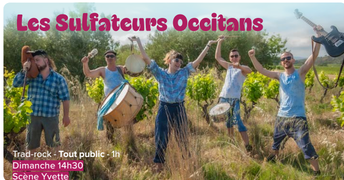
Trad-rock - Tout public - 1h Dimanche 14h30 Scène Yvette

Les Sulfateurs Occitans, c'est du balèti né de la rencontre de musiciens trad et rock qui donnent de la gnaque à la polka, de la fièvre au rondeau, du sentiment à la mazurka, du tempo à la valse... Un voyage à danser dans le grand Languedoc avec quelques escapades en Catalogne, Galice et Bretagne.